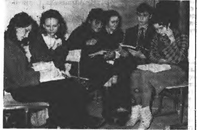
* Останні повторення перед екзаменом;