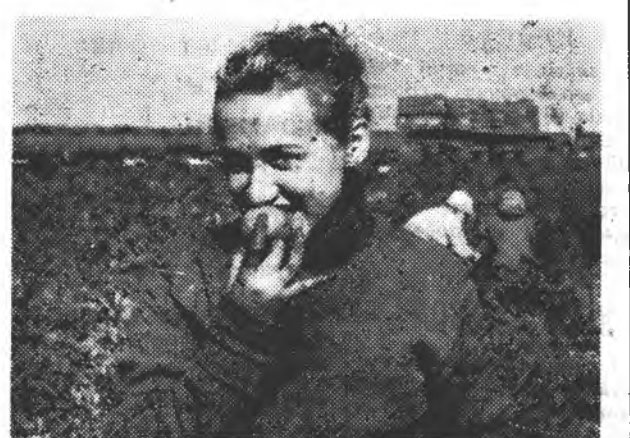
* Ох, і солодка ж помідора з херсонського поля, на яке не один рік виїжджають наші студенти для збирання врожаю.