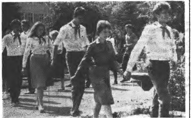
* Заняття піонервожатих — неодмінні у навчально-виховному процесі майбутніх педагогів;