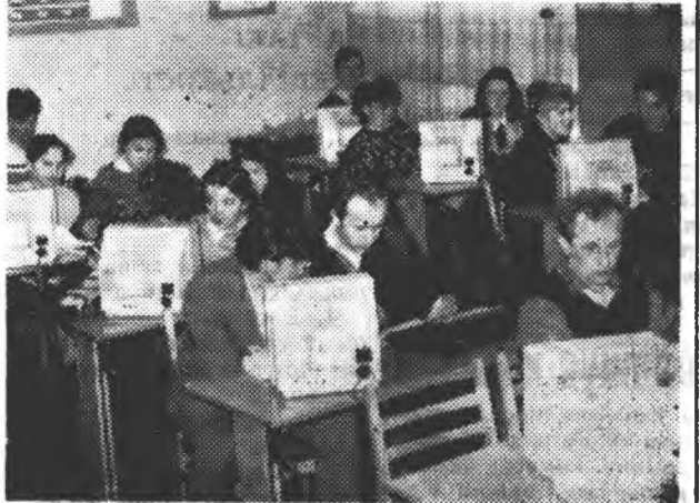
* Студенти фізико-математичного факультету із задоволенням займаються у класі персональних комп'ютерів;

Лише якусь грань, тільки одну мить студентського життя зафіксували на своїх знімках наші громадські фотокореспонденти Володимир Боб'як, Іван Тимінський та Ігор Семків. Але й тут, наче в краплині роси, заяскравили, відбилися зусбіч будні нинішніх стефаніківців — їх навчання, дозвілля, участь в громадсько-корисній роботі. Отож, знайомтесь: