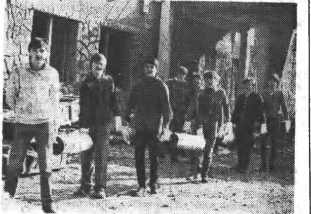
* Вміємо не тільки учитись, а й дружно працювати, особливо коли справа стосується студентського гуртожитку.